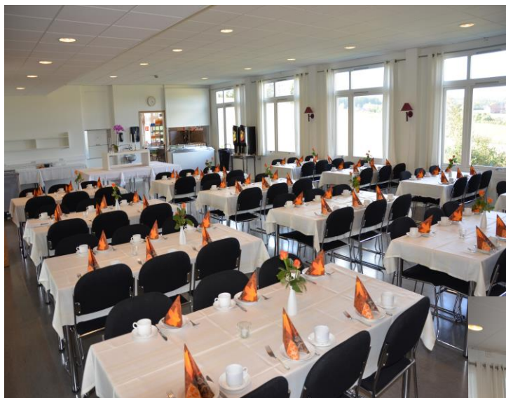
Bilder av peisestua og spisesalen som er pyntet til fest