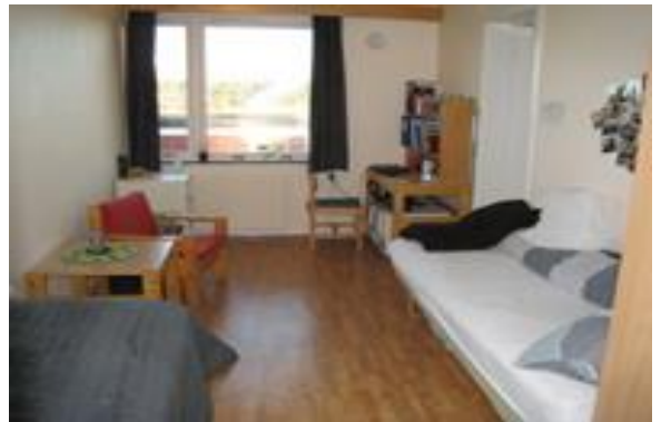
Bilde av et internatrom med tilhørende bad