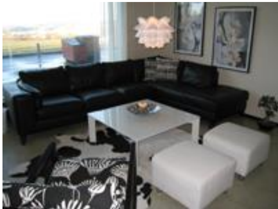
Fra en av småstuene på skolen